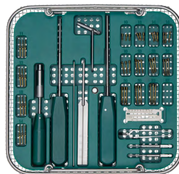
Ilustración 19.335.00 Hexágono interior