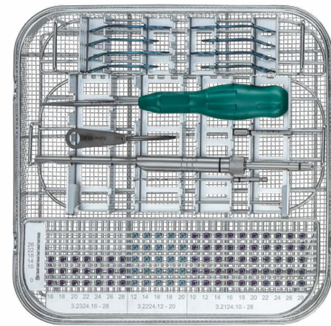
Set-Nr. 19.117.20 TOBI