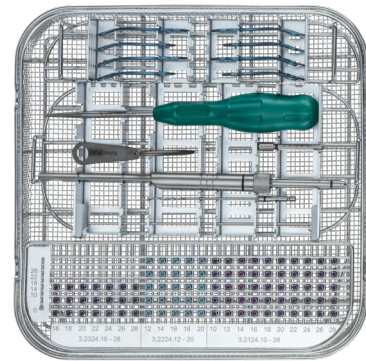
Set-Nr. 19.117.20 TOBI