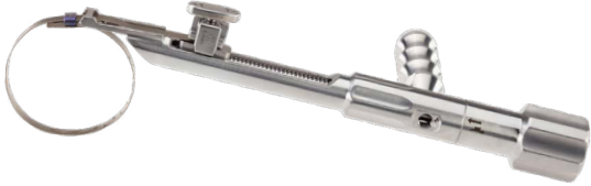
Hammer und Kraftschneider