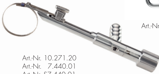
Art.-Nr. 10.271.20 Art.-Nr. 7.440.01 Art.-Nr. S7.440.01