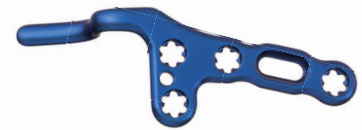
Art.-Nr. 5.3563.23/1416, rechts