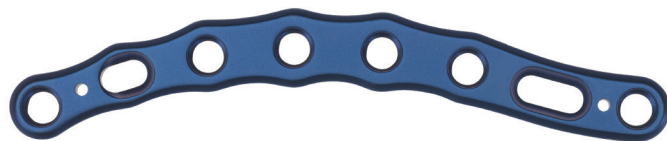
Art.-Nr. 5.3522.08, rechts